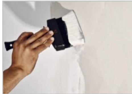
Paso 4 - Primera mano