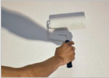
Paso 1 - Para iniciar aplica Primus Sabbia

Conservación: en un lugar seco, fresco, lejos de la humedad y las heladas.